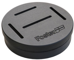
Porte-couteaux 8100 030